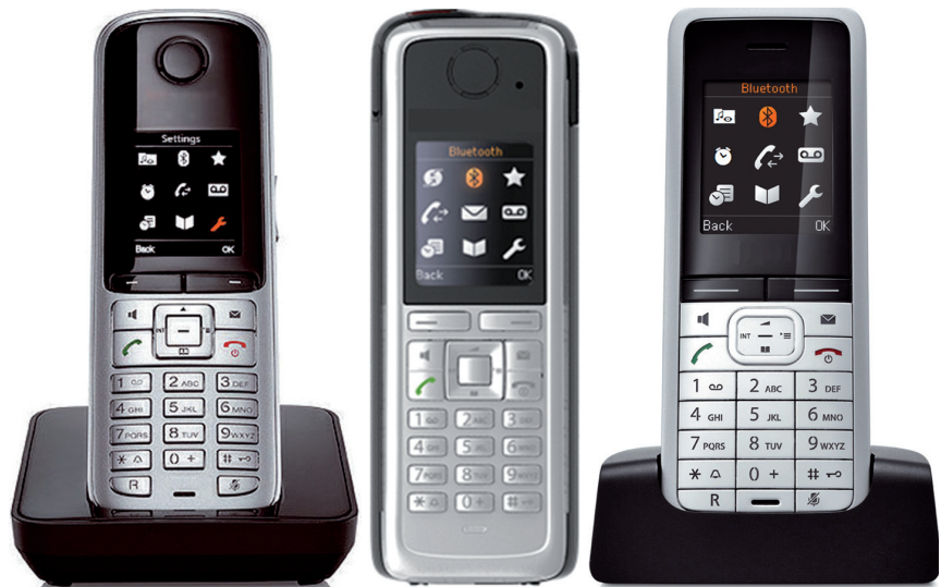
Gigaset S4 professional

Das OpenStage SL4 professional ist das kleinste und leichteste DECT-Mobilteil im Portfolio. Es erfüllt mit HighEnd-Funktionalität und Design höchste Ansprüche und passt perfekt zu vielen Arbeitsplätzen. Der Leistungsumfang ist mit dem drahtgebundener System-Endgeräte vergleichbar.